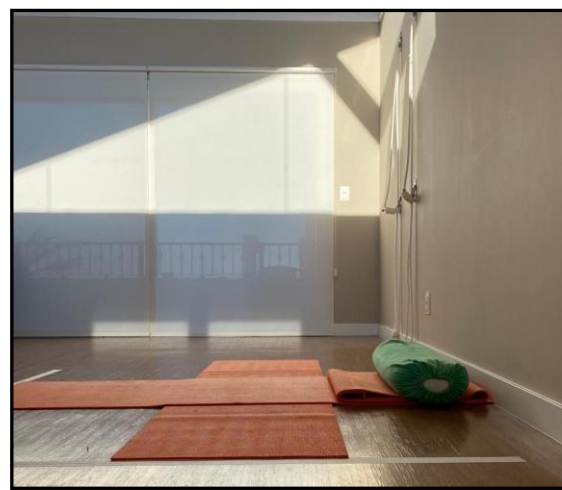
Tapetes cruzados e posicionamento das fitas no chão